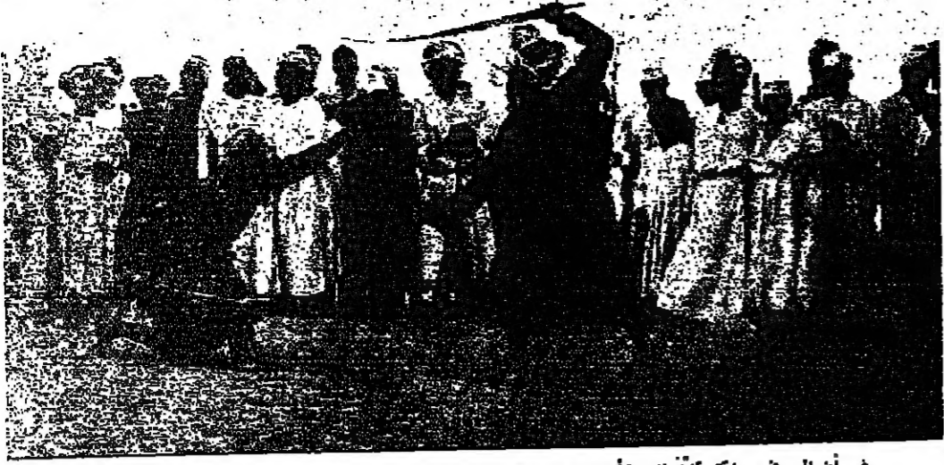
رغم أن السيوف حادة بآلة فإن الأصابع في رصعة العيد هذه نادرة بفضل الحركات الرشقة وهارة الأداء

سلطنة عمان أسرة كبيرة بين إبنائها فروع ومميزات مستقلة من ناحية المظهر، ولكنهم جميعا في جوهرهم يمثلون أسرة كبيرة متجانسة تسكن في بيت كبير مكون من ست غرف متداخلة: ولندا من الفرقة الجنوبية حيث سكان ظفار الذين ينتمي بعضهم الى الجنس الحامسي والبعض الآخر الى الجنس السامي، ولهم صلات قوية بسكان جنوب الجزيرة العربية الذين يعرفون باسم الشحوح وهم يعيشون في شبه جزيرة